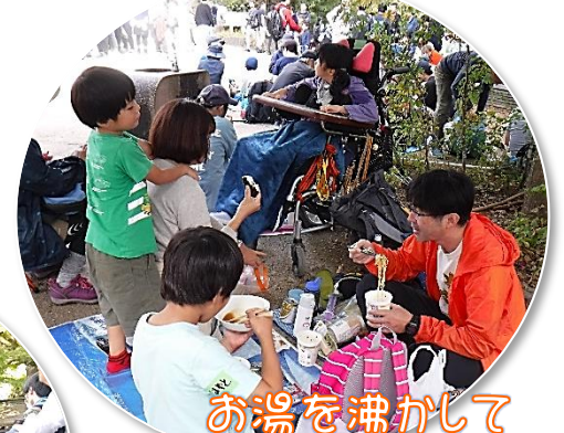
お湯を沸かして カップラーメン