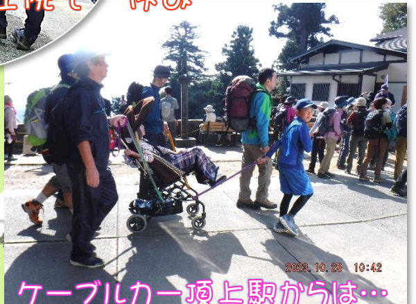
ケーブルカー頂上駅からは...