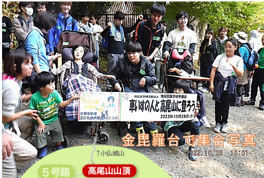
金毘羅台で集合写真