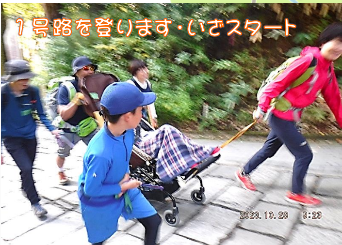
1号路を登ります・いざスタート